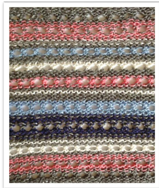
Farb- und Musterfolge