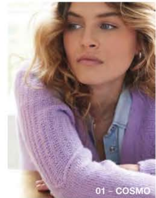
01 - COSMO