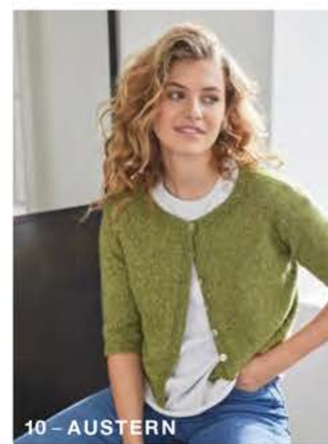
10 - AUSTERN