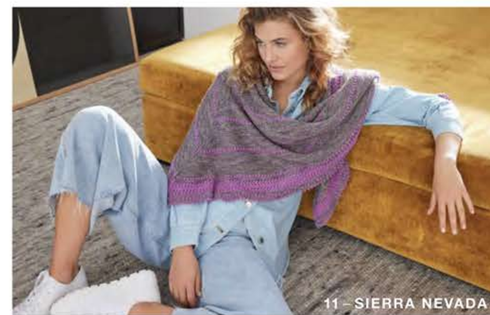
11 - SIERRA NEVADA