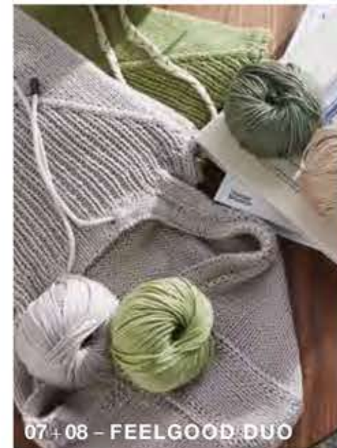
07 + 08 - FEELGOOD DUO