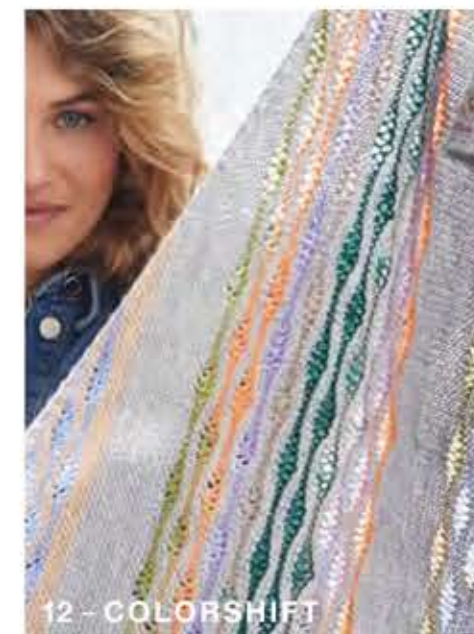
12 - COLORSHIFT