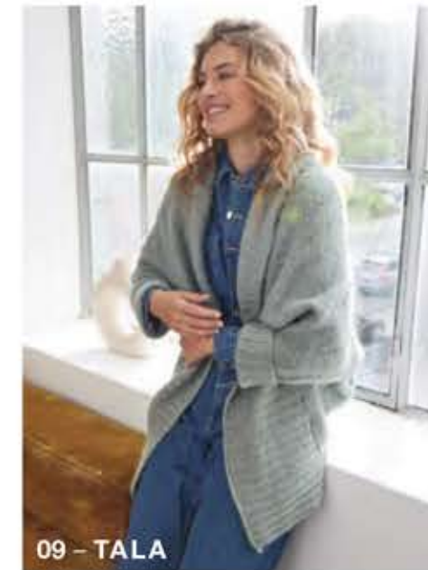
09 - TALA

„ COOL WOOL 4 SOCKS ist ein unkomplizierter Allrounder, der sich nicht nur bei Socken, sondern auch bei Großprojekten bestens bewährt: Die glatte Struktur ermöglicht ein ebenso gleichmäßiges wie plastisches Maschenbild. Wer es flauschig mag, verstrickt den Bestseller zusammen mit Silkhair oder Setasuri. TANJA STEINBACH