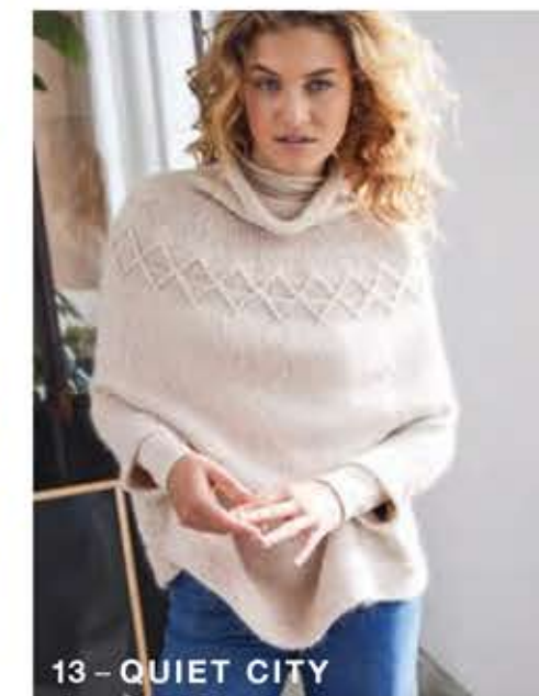
13 - QUIET CITY