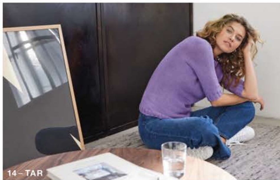
14 - TAR

„ Mit der PURO VEGANO habe ich mich für ein alltags-taugliches Garn entschieden, das höchsten Tragekomfort mit leichter Pflege vereint. Die beste Voraussetzung für Oberteile, an denen man sich viele Jahre erfreuen möchte. Mit einem Mix aus Baumwolle, Lyocell und Polyamid kommt das Kettengarn ganz ohne tierische Fasern aus. MELANIE BERG