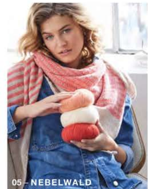
05 - NEBELWALD