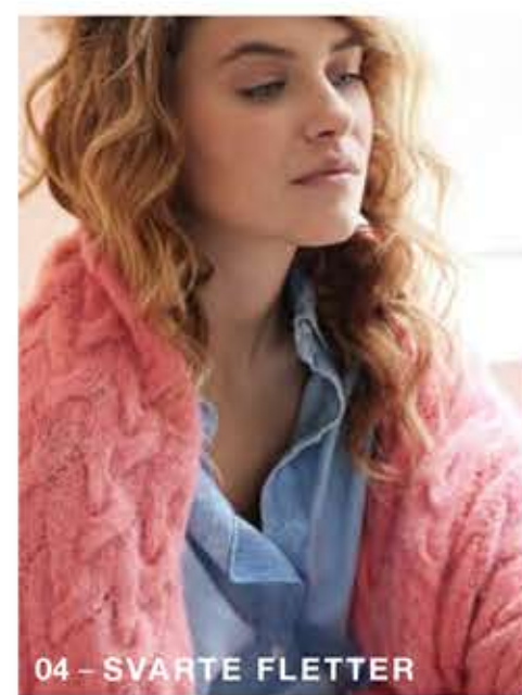
04 - SVARTE FLETTER