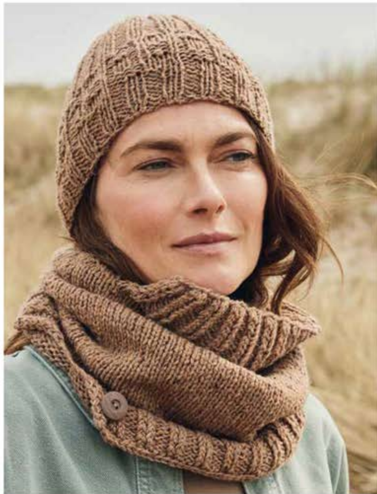
04 + 05 – MÛTZE, LOOP COUNTRY TWEED FINE (LANDLUST SOFT TWEED 180) + COOL WOOL LACE | 06 – LOUNGE PANTS COOL WOOL