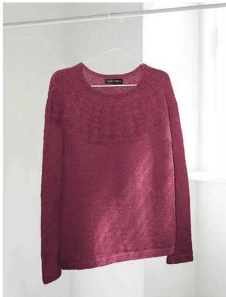
32 - PULLOVER MERINO UNO