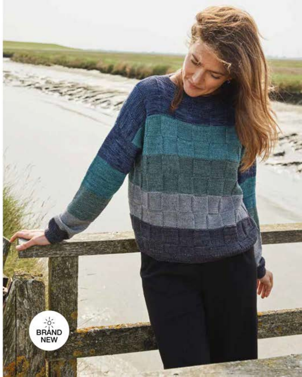
rechte Seite: 12 – PULLOVER COOL WOOL VINTAGE (Die Anleitung funktioniert auch mit COOL WOOL)