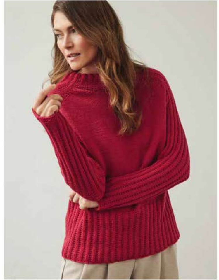
50 - V-PULLOVER MERINO UNO | 51 - PULLOVER COOL WOOL BIG