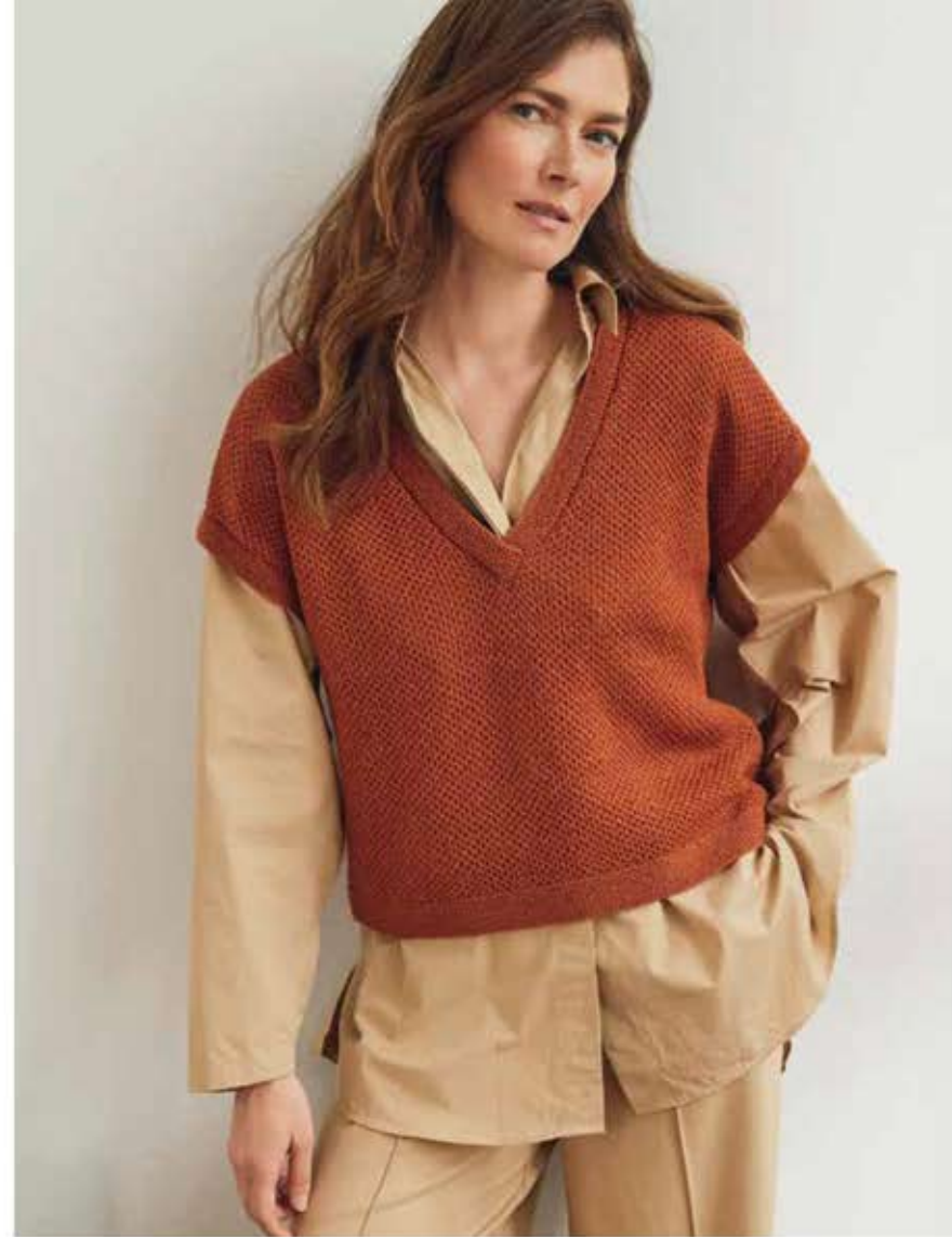
48 - PULLUNDER COOL WOOL LACE