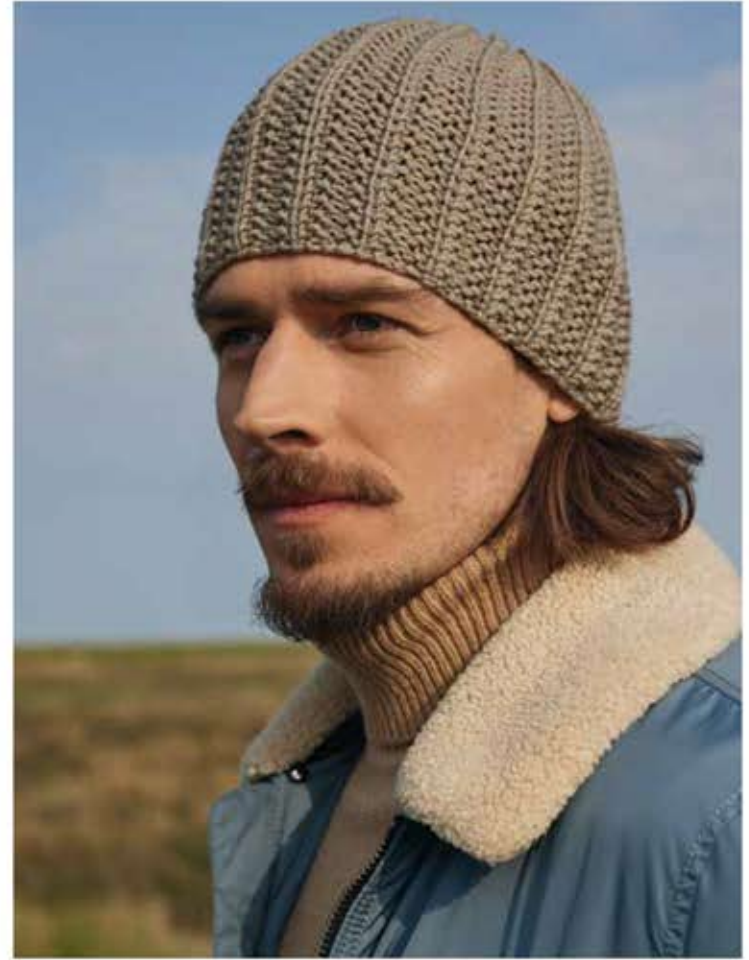
27 - ROLLKRAGEN-EINSATZ COOL WOOL BIG | 28 - MÜTZE BINGO