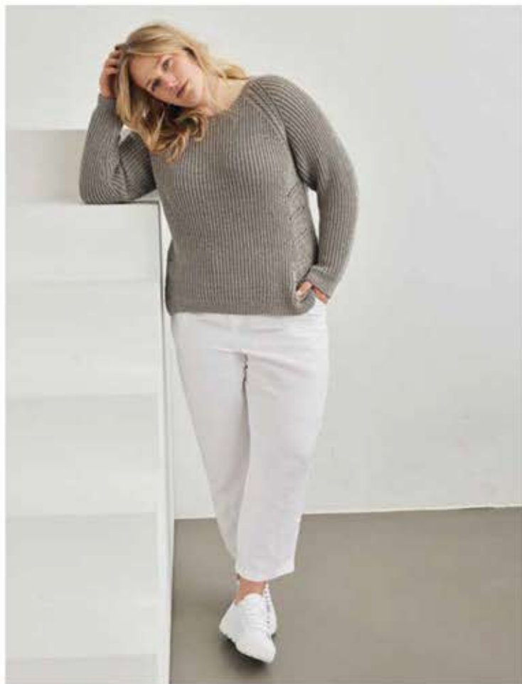
34 - PULLOVER COOL WOOL, rechts: 35 - ROLLKRAGEN-EINSATZ BINGO