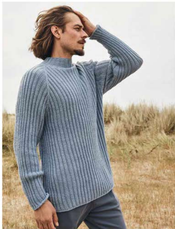
18 - PULLOVER MERINO UNO | 19 - JACKE COOL WOOL SETA