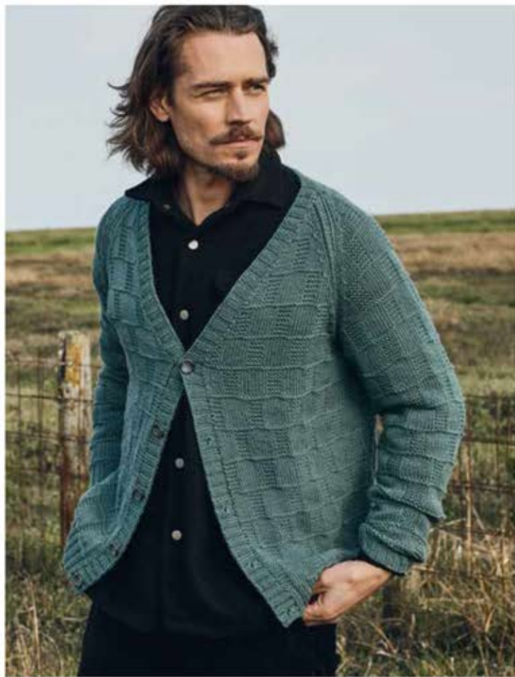
23 - JACKE COÖL WOOL BIG | 24 + 25 - MÛTZE, SCHAL MERINO UNO