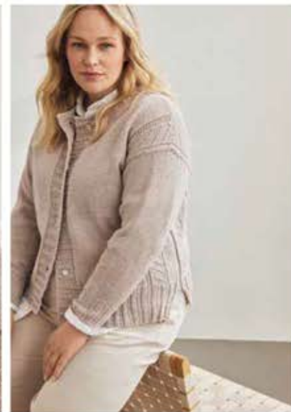
29 - JACKE COOL WOOL BIG