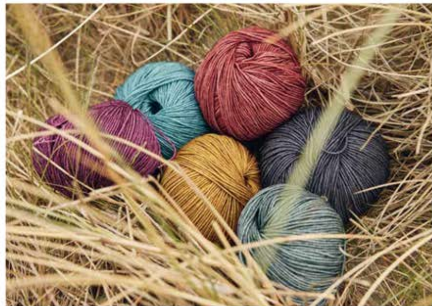
07 – ROLLKRAGEN-EINSATZ COOL WOOL VINTAGE

Auf den Nadeln unverzichtbar sind die bewährten Klassiker COOL WOOL und COOL WOOL BIG. In dieser Saison überraschen beide Qualitäten als dezent bedruckte Version in zehn Farben. Neben Anthrazit und Helldgrau gibt es acht edle Töne, die durch ihre leicht changierende Optik an Juwelen erinnern. Das Ergebnis sind ausdrucksvolle Strickbilder, die auch einfache Teile gut aussehen lassen.