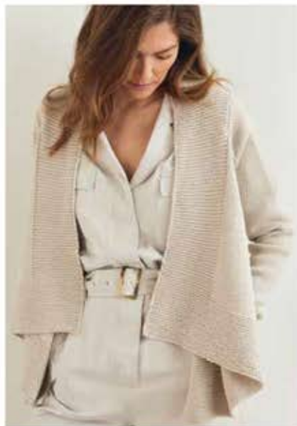
46 – CARDIGAN COOL WOOL BIG