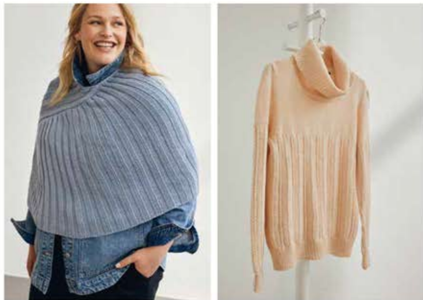
40 | 41 – PONCHO | PULLOVER (Mitte und rechts) COOL WOOL BIG