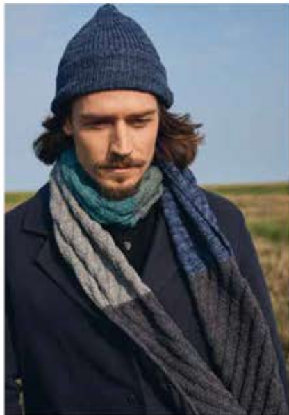
08 + 09 – MÜTZE, SCHAL COOL WOOL VINTAGE