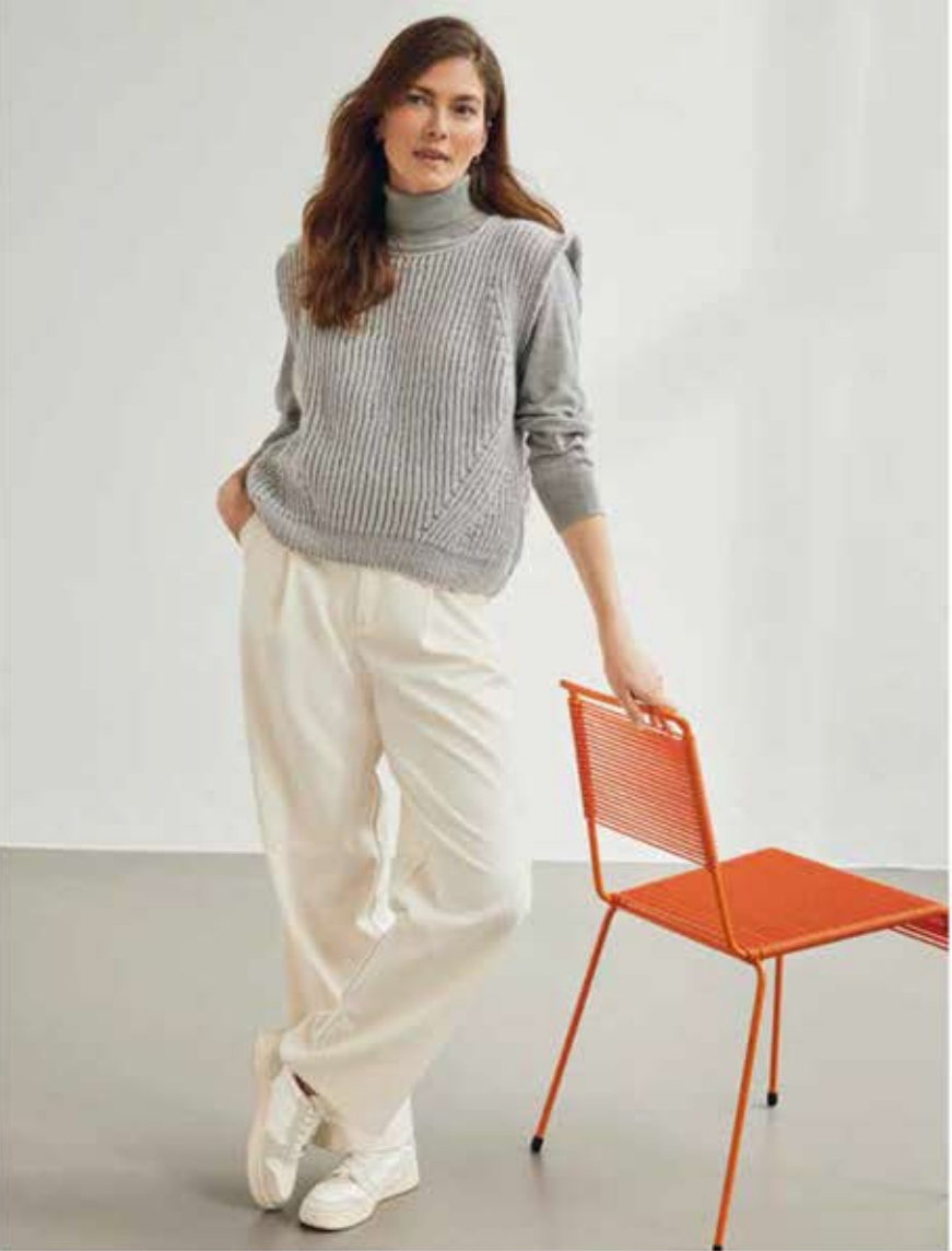
47 - PULLUNDER MERINO UNO