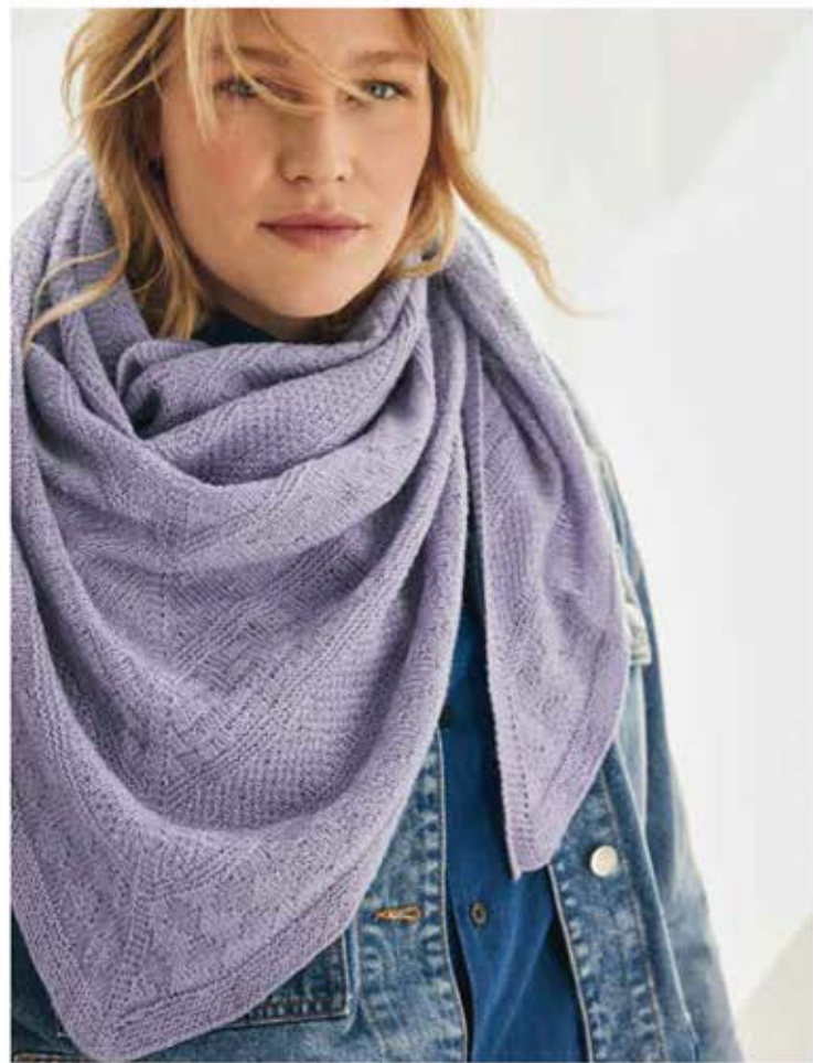
43 - DREIECKSTUCH COOL WOOL LACE | 44 - PONCHO BINGO