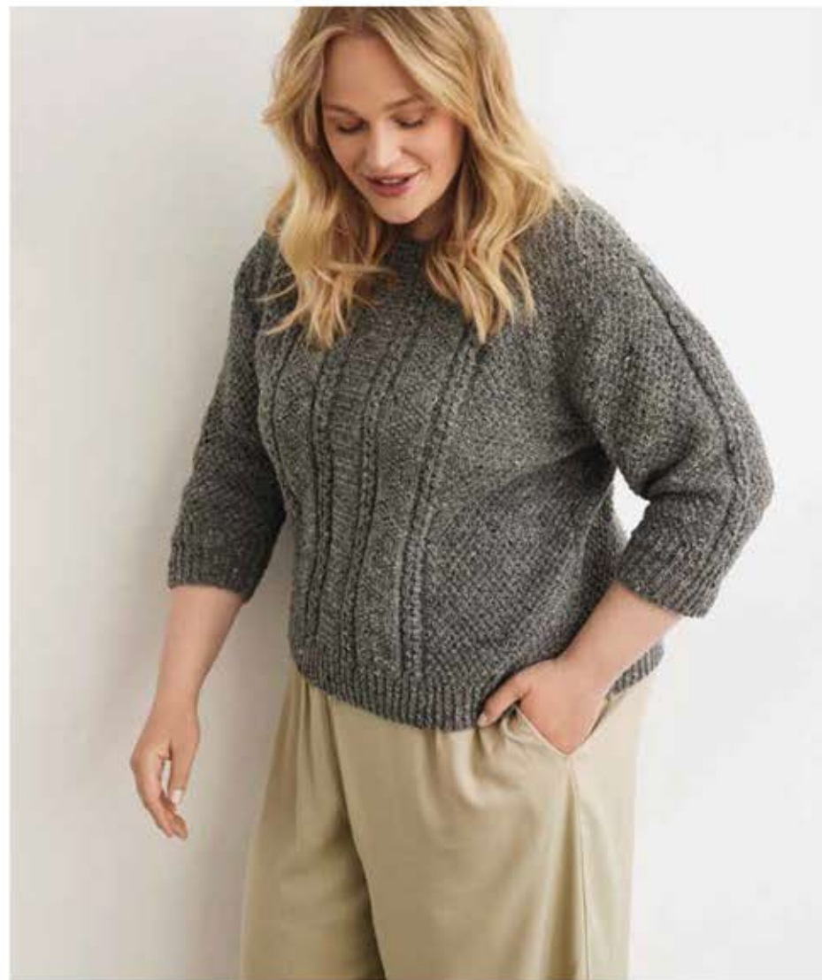
42 - PULLOVER COUNTRY TWEED FINE (LANDLUST SOFT TWEED 180)