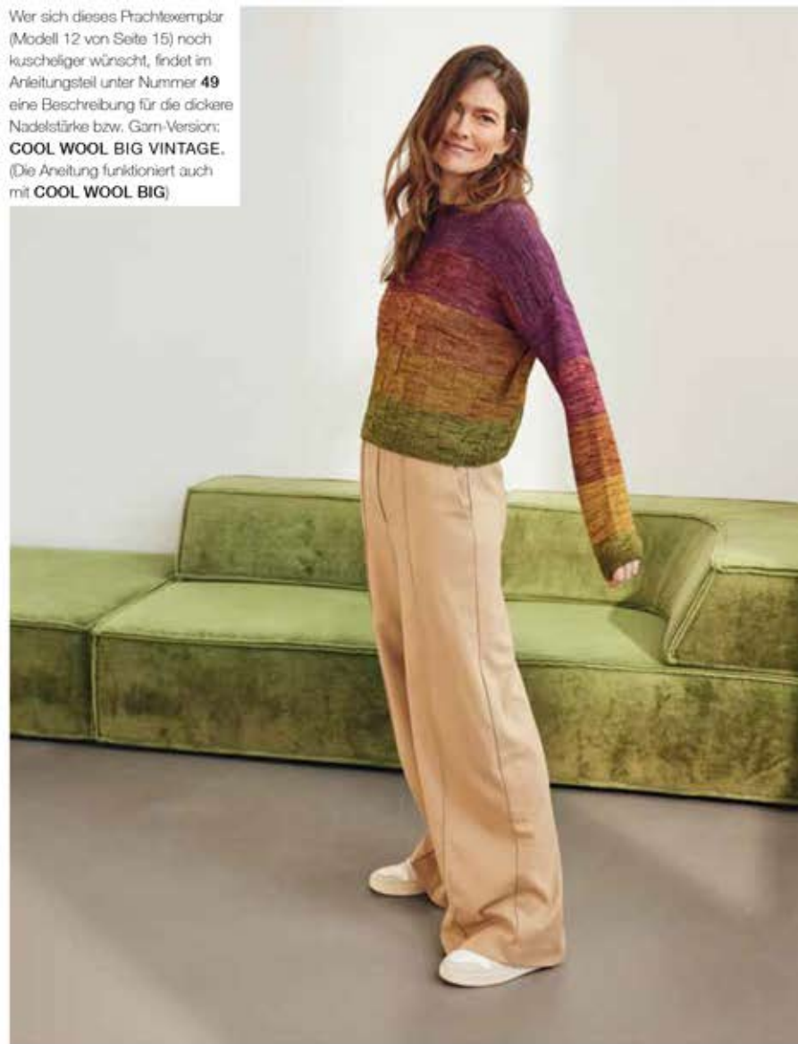
PULLOVER – COOL WOOL VINTAGE, Mod.12 von Seite 15

Wer sich dieses Prachtexemplar (Modell 12 von Seite 15) noch kuscheliger wünscht, findet im Anleitungsteil unter Nummer 49 eine Beschreibung für die dickere Nadelstärke bzw. Garn-Version: COOL WOOL BIG VINTAGE . (Die Anleitung funktioniert auch mit COOL WOOL BIG )