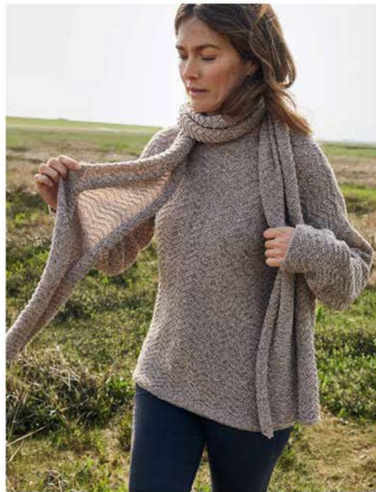
16 + 17 – PULLOVER, SCHAL COOL WOOL LACE