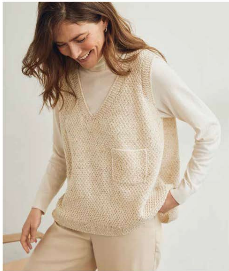
36 - PULLUNDER MERINO SUPERIORE | 37 - COUNTRY TWEED FINE (LANDLUST SOFT TWEED 180)