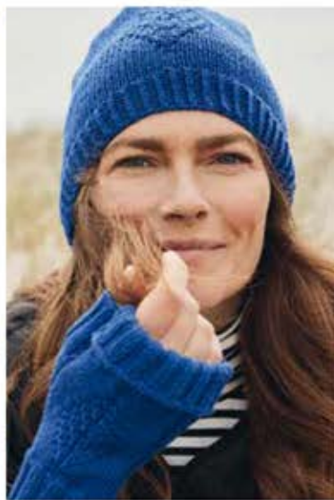
01 – PULLOVER COOL WOOL BIG | MÜTZE, STULPEN COOL WOOL (Mod. 14 + 15, Seite 17)