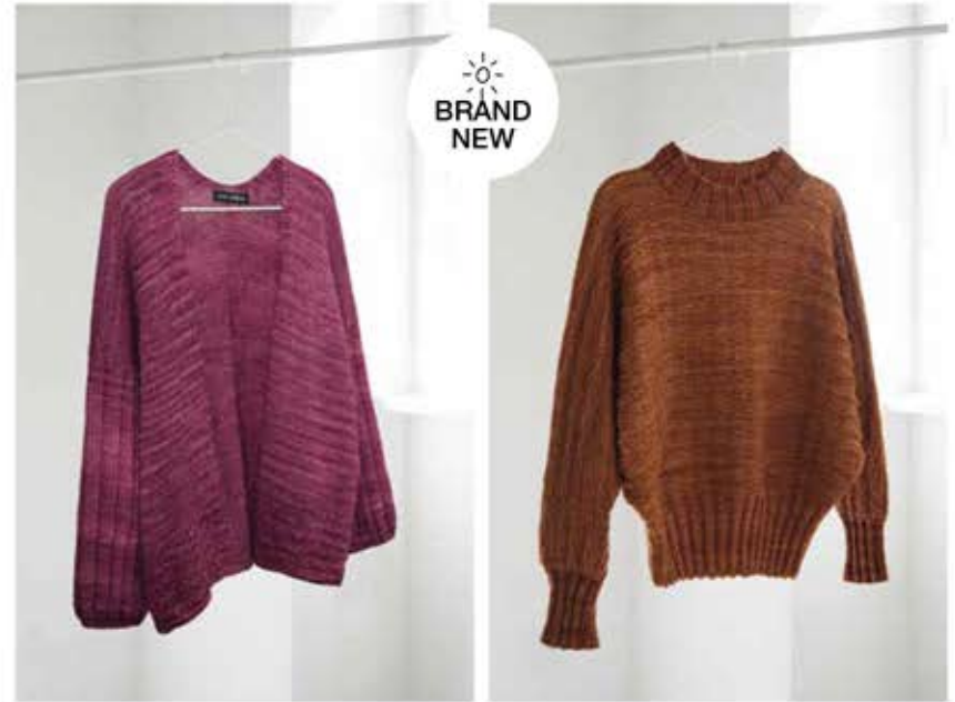
33 – CARDIGAN COOL WOOL BIG | COOL WOOL BIG VINTAGE rechts: PULLOVER COOL WOOL BIG VINTAGE (Mod. 01 von Seite 4/5)