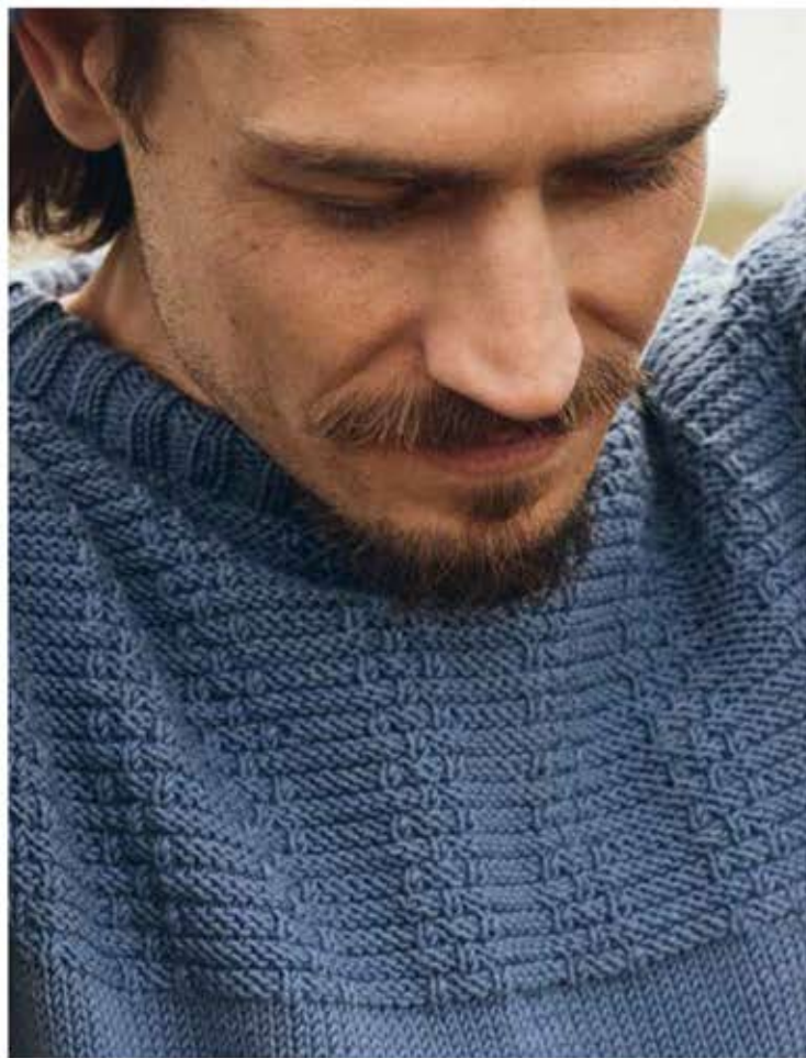
26 - PULLOVER COOL WOOL