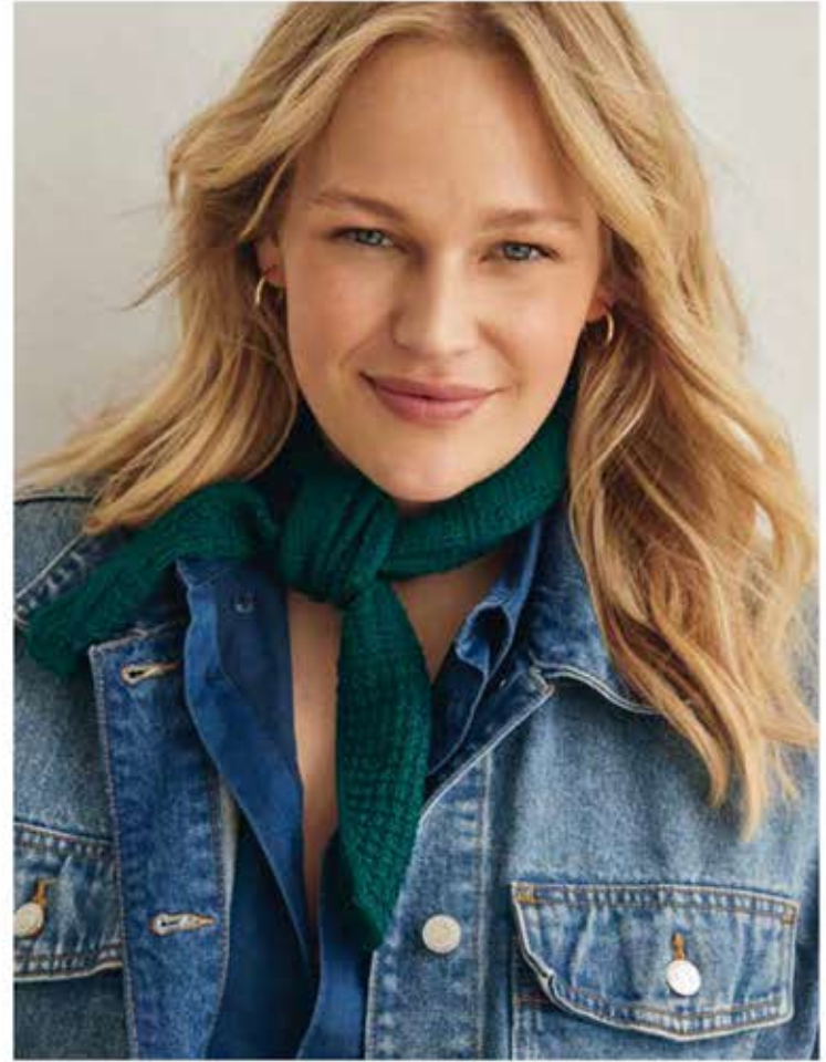
38 - PULLOVER MERINO UNO | 39 - HALSTUCH COOL WOOL LACE