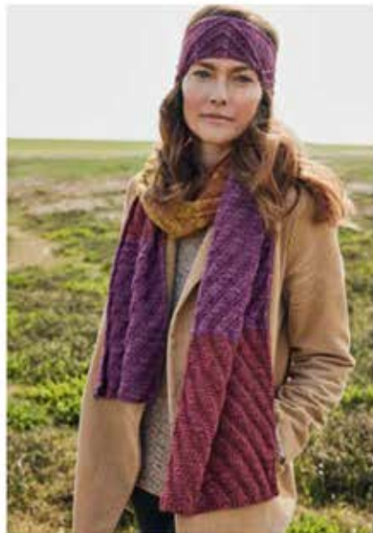
10 + 11 – STIRNBAND, SCHAL COOL WOOL BIG VINTAGE