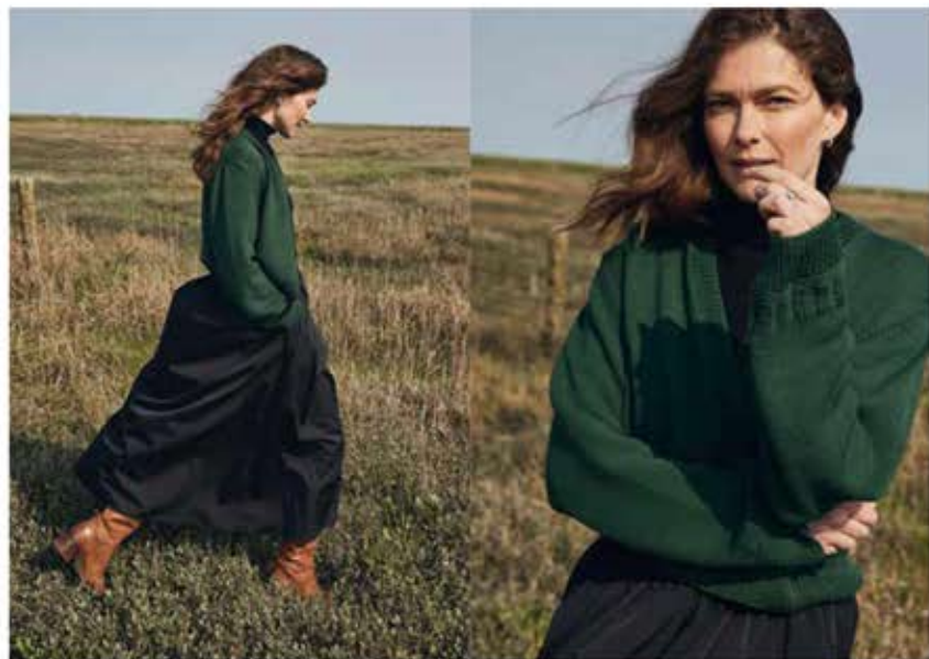
03 - JACKE MERINO SUPERIORE