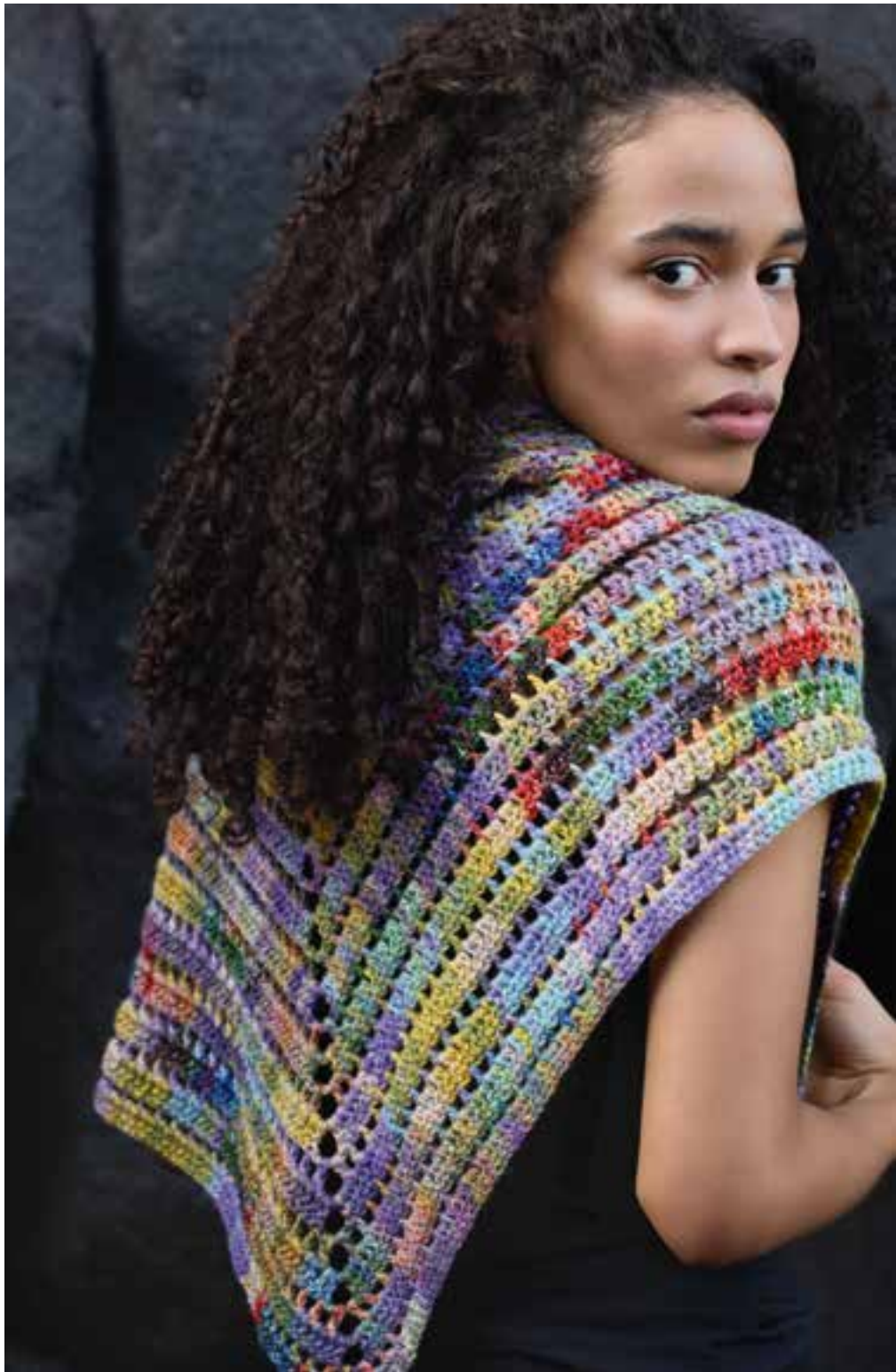
27–Cotonella | rechts: 28–Gomitolo TONO