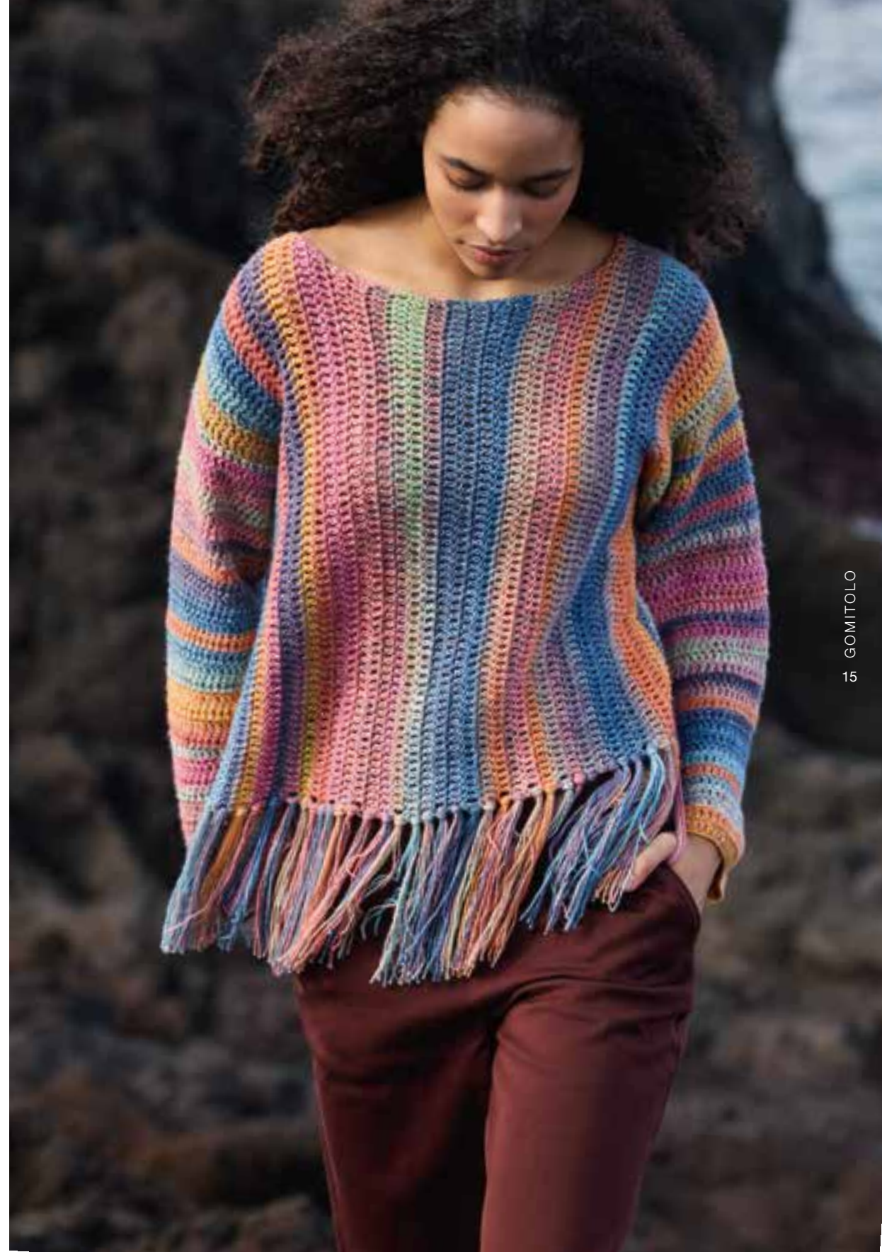
11–Gomitolo HIPPIE | rechts: 12–Gomitolo MAMBO