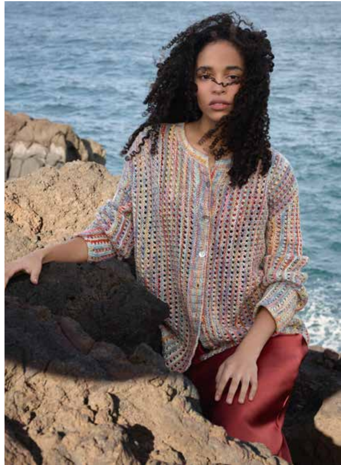
links: 09-Cotonella+Cotonella MULTI | 10-Cotonella MULTI