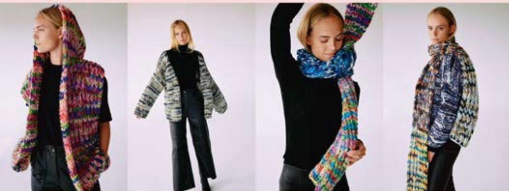
41 Kapuzen-Weste / Hooded Vest & 42 Cardigan & 43 Schal / Scarf & 44 / 43 Cardigan & Schal / Scarf CONFETTI