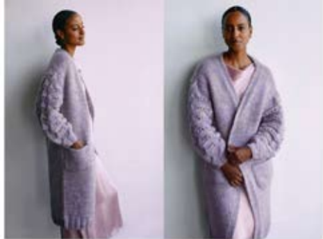
15 MANTEL / COAT LALA BERLIN SMOOTHY