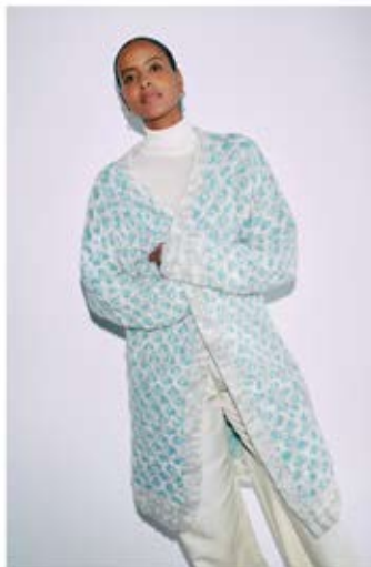
02 MANTEL / COAT LALA BERLIN SMOOTHY & LALA BERLIN BUFFY