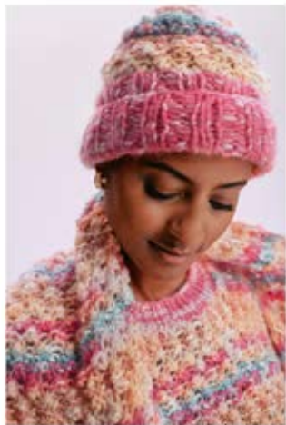
18 / 19 / 20 PULLOVER / JUMPER & MUTZE / CAP & SCHAL / SCARF LALA BERLIN BUFFY & LALA BERLIN SMOOTHY