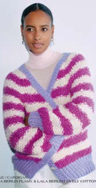
00 JACKE / CARDIGAN LALA BERLIN FLAMY & LALA BERLIN LOVELY COTTON