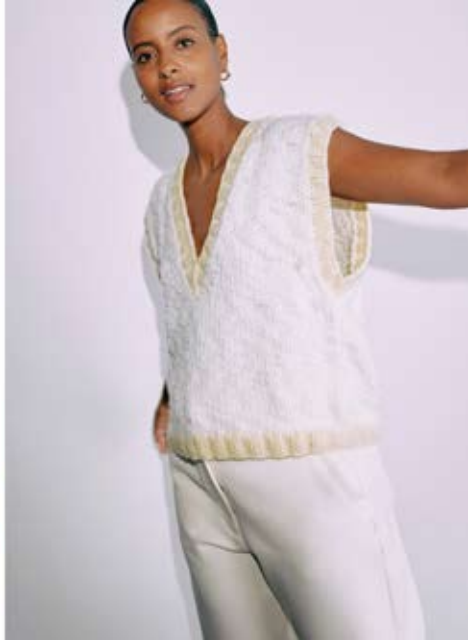
13 / 14 PULLUNDER / VEST: LALA BERLIN FLAMY & LALA BERLIN LOVELY COTTON MÜTZE / BEANIE: LALA BERLIN FLAMY