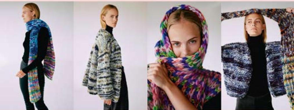
43 Schal / Scarf & 42 Cardigan & 41 Kapuzen-Weste / Hooded Vest & 44 / 43 Cardigan & Schal / Scarf CONFETTI