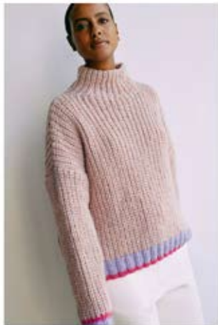
03 PULLOVER / JUMPER LALA BERLIN LOVELY COTTON