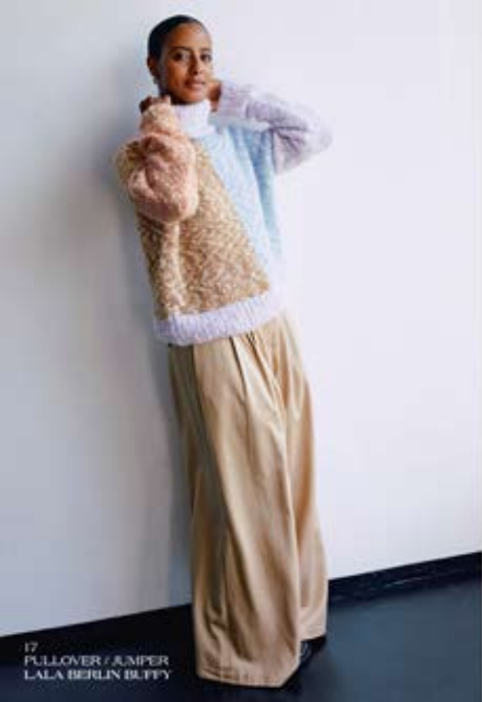
17 PULLOVER / JUMPER LALA BERLIN BUFFY