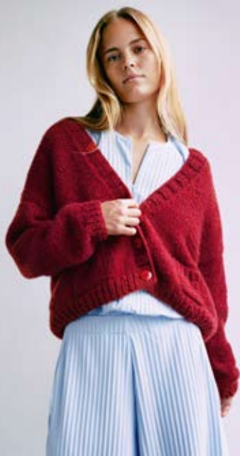
55 Pullover / Jumper CASHMERE 16 FINE Rechts 56 Jacke / Cardigan ECO PUNO CHUNKY