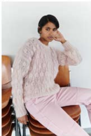
31 / 32 Pullover / Jumper & Balaklava MOHAIR MODA