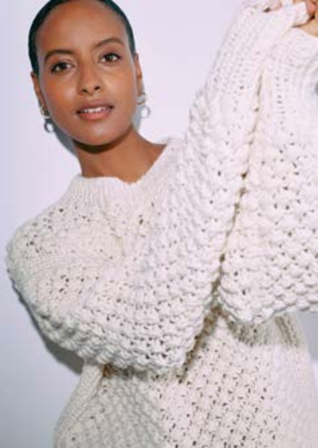
05 / 06 PULLOVER / JUMPER & MÜTZECAP LALA BERLIN LOVELY COTTON