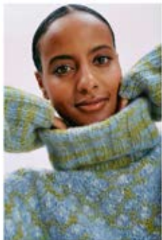
04 PULLOVER / JUMPER LALA BERLIN SMOOTHY & LALA BERLIN BUFFY