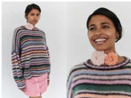
35 / 36 / 37 Pullover / Jumper & Balakava & Häkelblüten / Crochet Flowers SILK-HAIR