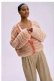
21 JACKE / CARDIGAN LALA BERLIN SMOOTHY & LALA BERLIN LOVELY COTTON 22 PULLOVER / JUMPER LALA BERLIN SMOOTHY