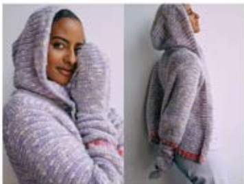
07 / 08 KAPUZENJACKE / HOODED CARDIGAN & FÄUSTLINGE / GLOVES LALA BERLIN SMOOTHY & LALA BERLIN BUFFY