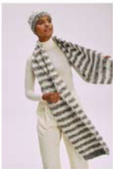
11 / 12 MÜTZE / CAP & SCHAL / SCARF LALA BERLIN FLAMY 23 / 24 PULLOVER / JUMPER & MÜTZE / CAP LALA BERLIN SMOOTHY & LALA BERLIN LOVELY COTTON