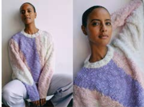
16 PULLOVER / JUMPER LALA BERLIN FLAMY