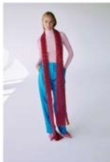
48 Jacke / Cardigan WOCHHO 49 Häkelschal / Crochet-Scarf WOCHHO