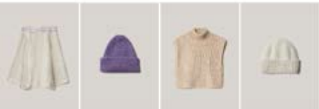
09 NATURAL ALPACA PELLO