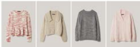
13 NATURAL ALPACA PELLO