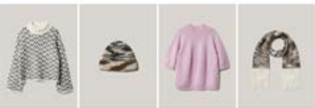
17 NATURAL ALPACA PELLO