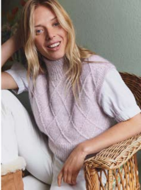
01 NATURAL ALPHA_FELD - Ein Pullover von Doro 1071, überstrich in einer angenehmen Variante. Ein Teil besteht aus hochwertigem Merino, dessen plüschige Optik ohne Hilfsmittel entsteht.