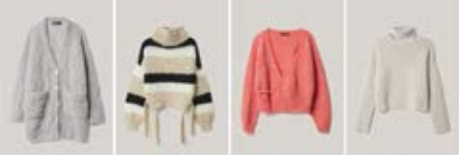
01 NATURAL ALPACA LUNGO