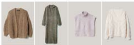
21 NATURAL ALPACA CLASSICO & SETAGUR