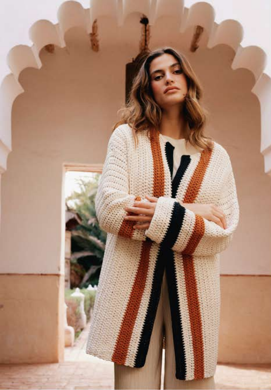
14 · Cardigan mit Kontraststreifen aus THE TUBE FINE .