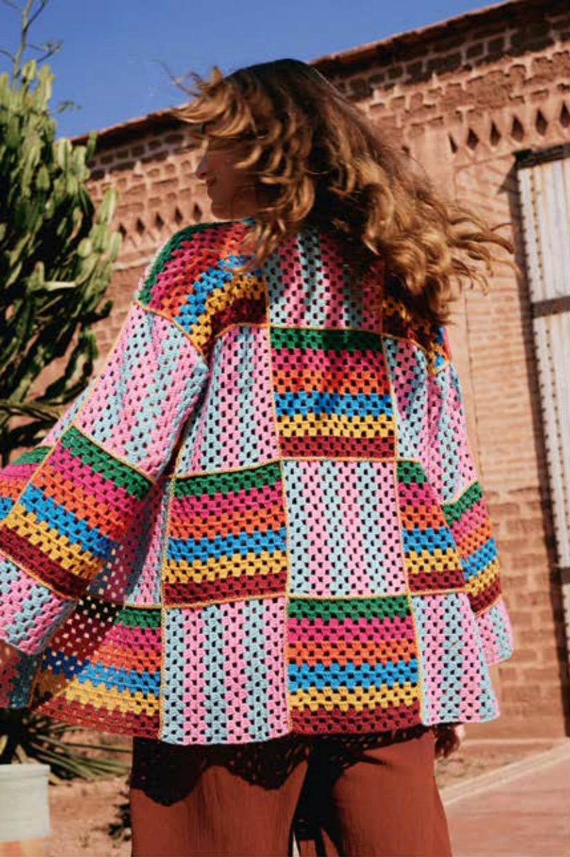
18 · Übergroßer, doppelreihiger Cardigan mit gestreiften Squares für den ultimativen Patchwork-Look aus ELASTICO .