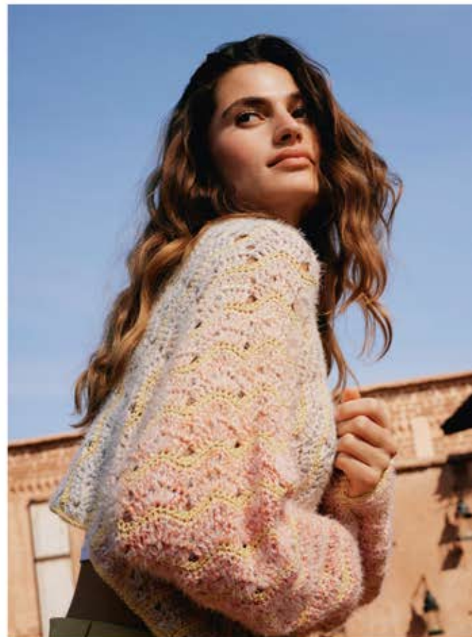
7 · Muster- und Materialmix in pastelligem Farbverlauf aus GOMITOLO SOLE, CAPRI & PER FORTUNA.