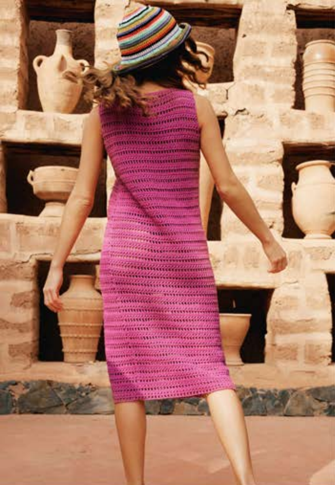
21 · Hut in bunten Ringeln aus ORGANICO .