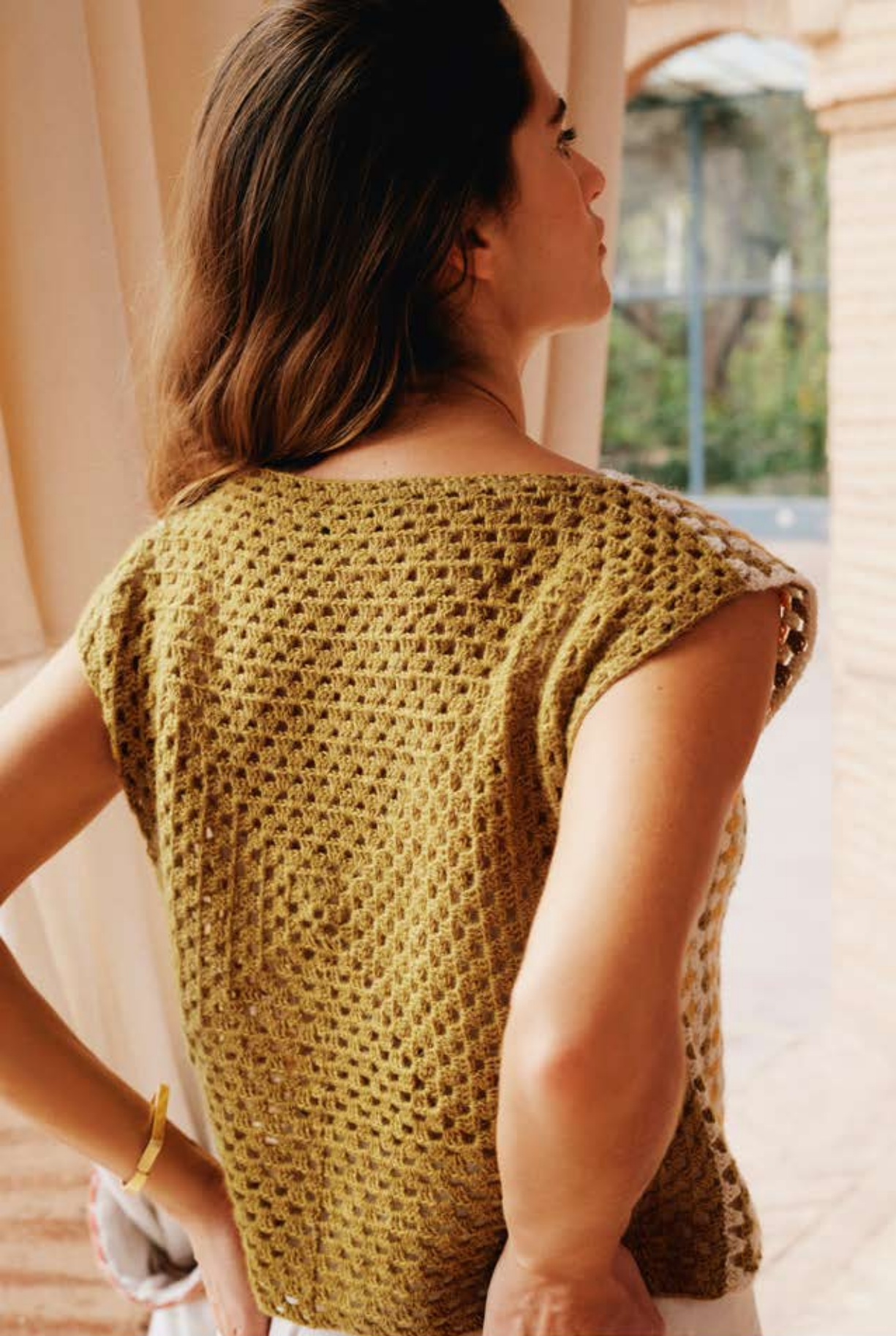
17 · Easy für Einsteiger – Top aus zwei Granny Squares, vorne gemustert, hinten uni – aus ECOPUNO .