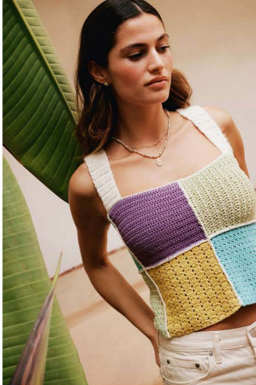
26 · Muster-Patchwork aus SOLO LINO mit Flausch auf den Trägern aus PER FORTUNA .