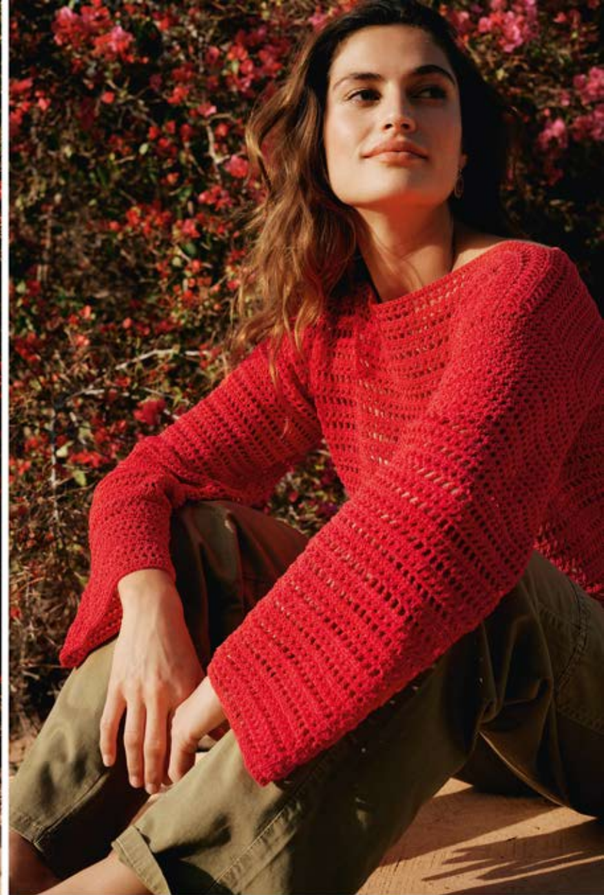
30 · Pullover mit U-Boot-Ausschnitt und geraden Ärmeln aus CAPRI .