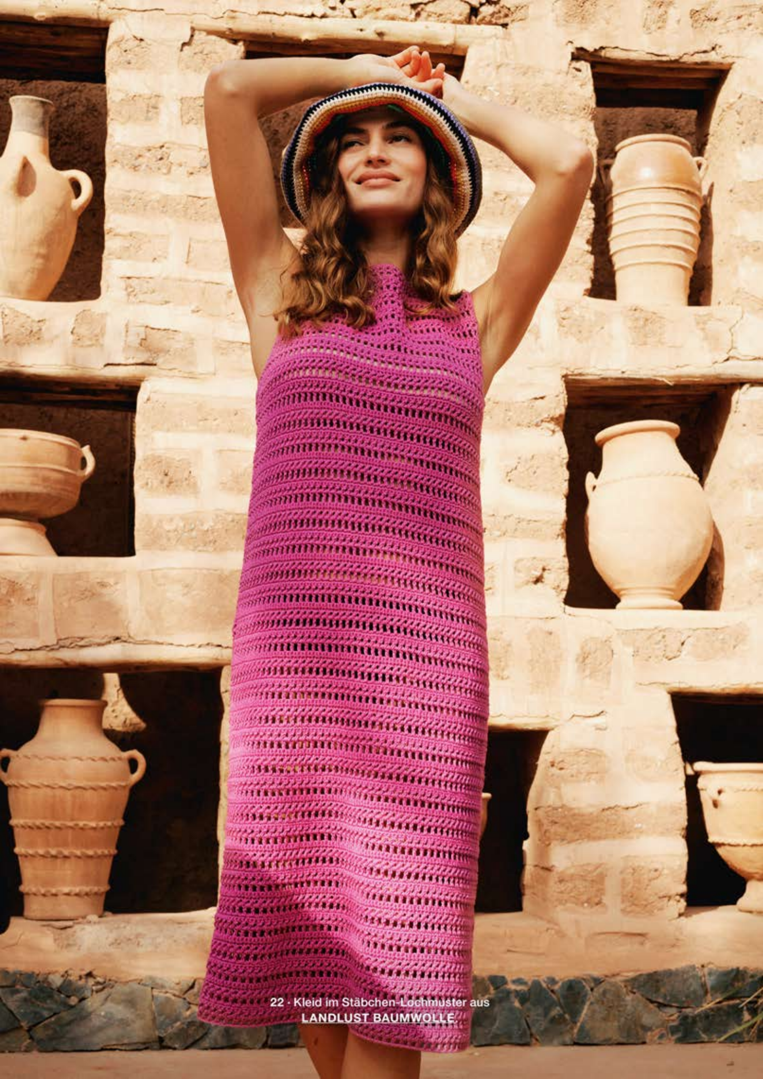
22 · Kleid im Stäbchen-Lochmuster aus LANDLUST BAUMWOLLE.